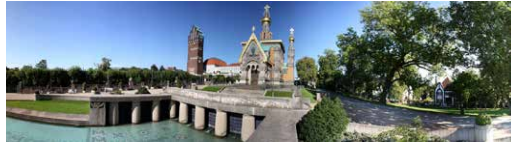
Mathildenhöhe (mit Hochzeitsturm, russ. Kapelle), Merck Innovation Center, Orangerie, Darmstad-tium, Residenzschloss, ESA Kontrollzentrum, EUMETSAT

Leben und Wohnen machen Spaß in dieser kleinen Großstadt mit ihren Einkaufsmöglichkeiten, der Nähe zur Natur, den Parkanlagen und ihren vielen liebenswerten Ecken und Quartieren.